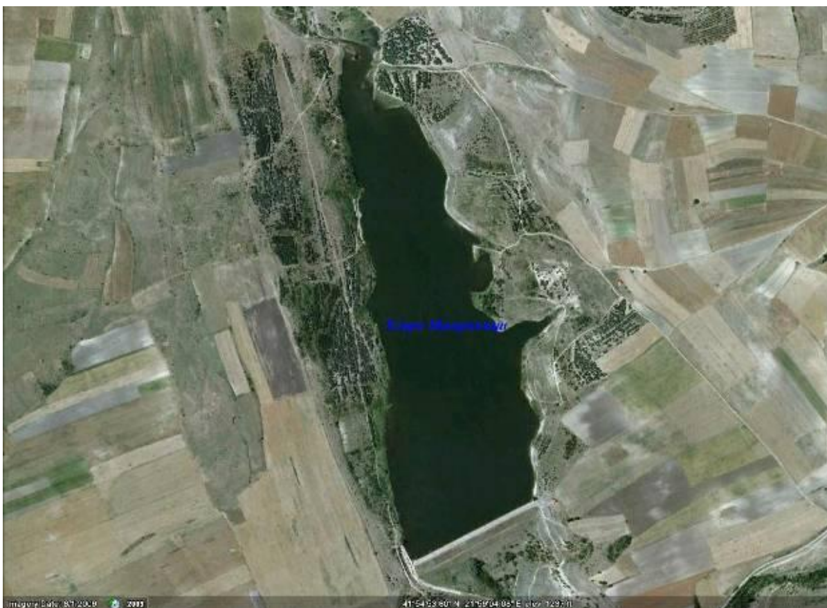
Слика 2. Сателитска снимка од акумулацијата Мавровица.